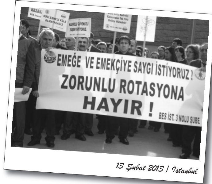
13 Şubat 2013 | İstanbul

Tek Gıda İş Sendikası, bir süredir ÇAYKUR'un ve Öz Gıda İş'in oyunları nedeniyle yetki sorunu yaşıyordu. 4 yıllık bir hukuksal mücadele yürüten sendika sonunda Yargıtay'dan gerekli onayı aldı ve ÇAYKUR ile TİS masasına