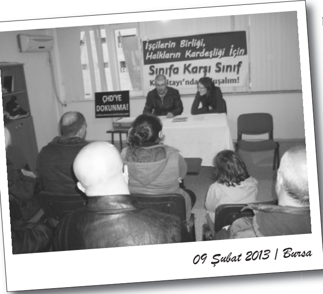
09 Şubat 2013 | Bursa