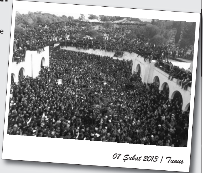
07 Şubat 2013 | Tunus

Ayrıca Halkçı Cephe'nin de aralarında bulunduğu muhalefet partileri meclisi boykot etme kararı aldı.