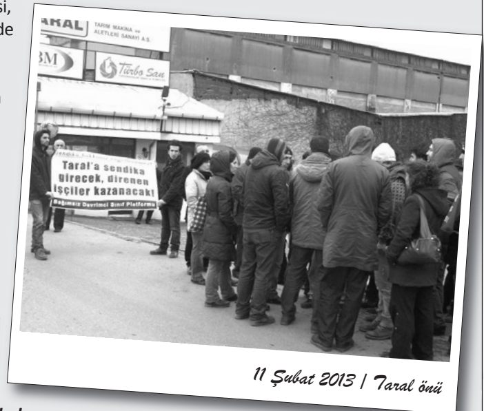
11 Şubat 2013 | Taral önü