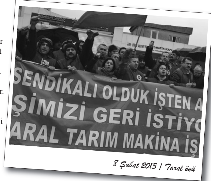
8 Şubat 2013 | Taral önü

Direnişin 9. gününde işçiler sabah erken saatte direniş alanına gelerek servisleri karşıladılar. Çay paydosunda dışarı çıkan sendikali işçilerle bilgi alış veriş yapıldı. Öğlen saatlerinde direnişçilerin bir kısmı Çorlu'daki mitinge gitmek için yola çıktı. Akşam