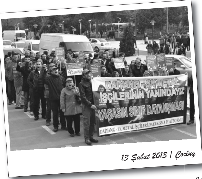
13 Şubat 2013 | Çorlu

Daiyang-SK Metal Greviyle Dayanışma Platformu 9 Şubat'ta gerçekleştirdiği eylemle, işçiler kazanana kadar dayanışma içerisinde olacaklarını açıkladı.